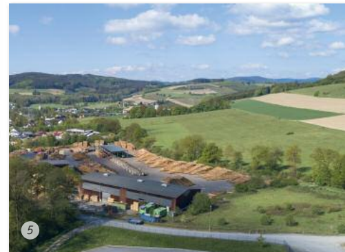
Die Baugebiete in Cobbenrode (1), Eslohe (2), Kückelheim (3), Wenholthausen (4a/4b) und Bremke (5)