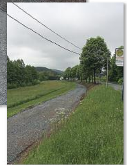
Der Radweg Richtung Cobbenrode (v.l.n.r.): Höhe Bremscheid, Isingheim, Bockheim, vor Cobbenrode