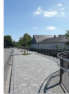
Ortskern Eslohe: Papestraße, Platz der Deutschen Einheit, Esselpromenade